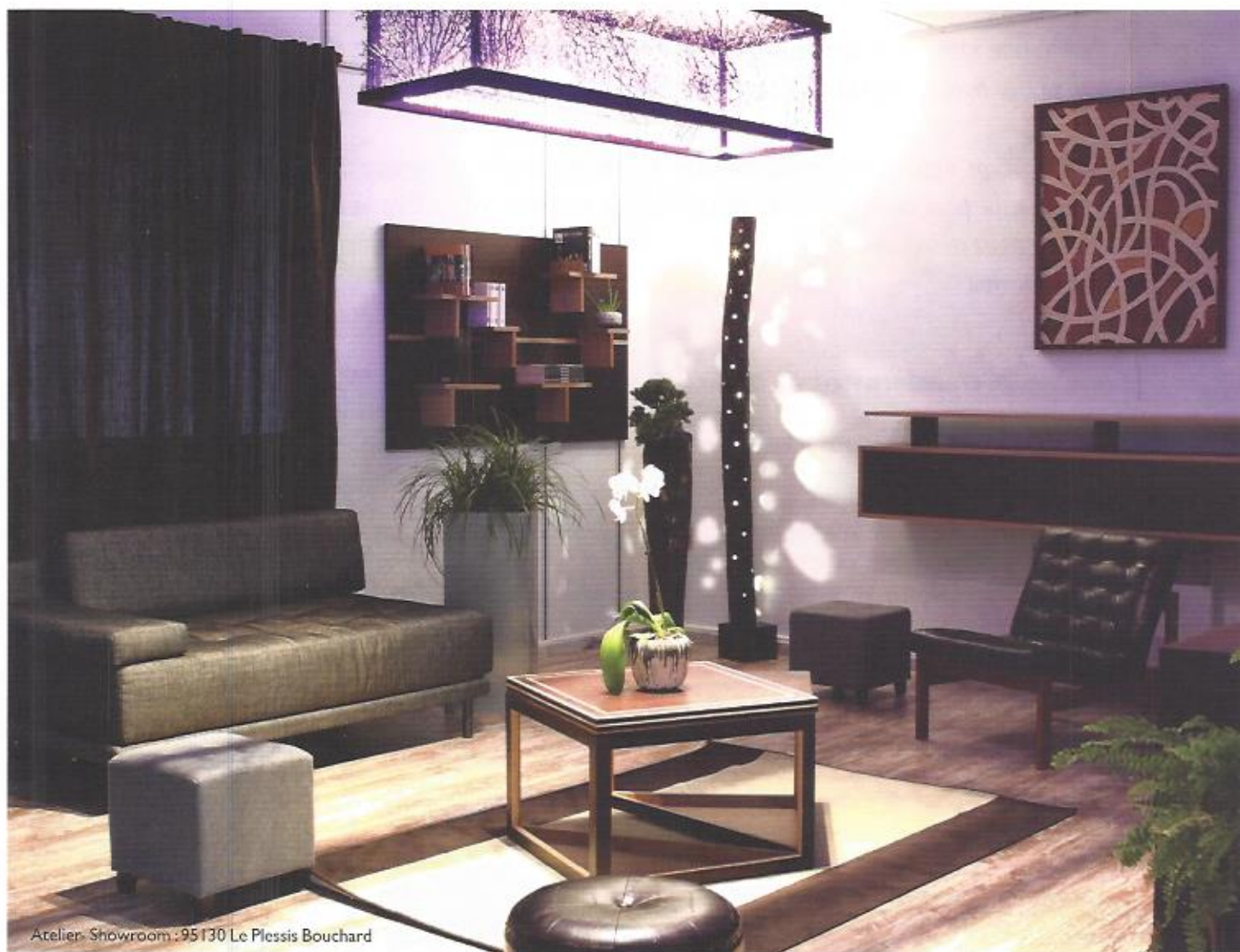
Atelier Showroom : 95130 Le Plessis Bouchard

MEUBLES • AGENCEMENT • LUMINAIRES • OBJETS DE DÉCORATION