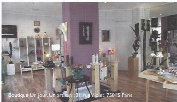
Boutique Un jour, un artisan : 31 rue Violet, 75015 Paris

Boutique « Un jour, un Artisan » 31 bis rue Violet - 75015 Paris